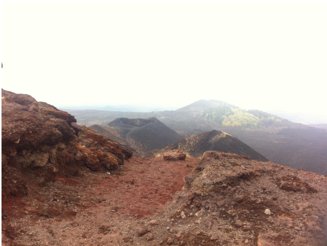
Etna, 1986 metara nadmorske visine

vrijeme zime, sele se u visoke krajeve, gdje hiberniraju, odnosno miruju, a što više odu, to je temperatura niža, što usporava probavu, te tako imaju veće šanse da prežive zimu. Ne rade to samo bubamare, već se one na crnom kamenu Etne najviše primijete, pa se čovjek lako prevari i pomisli da su one iznimka. Ipak, doista je čudno vidjeti toliku koncentraciju bubamara na jednom mjestu, za razliku od npr. skakavaca ili komaraca, na koje smo već navikli.