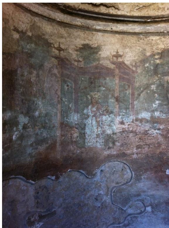
Freska iz Pompeja