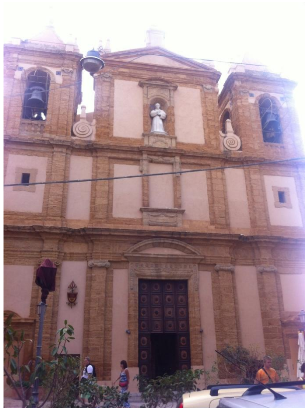
Crkva sv. Franje Asiškog