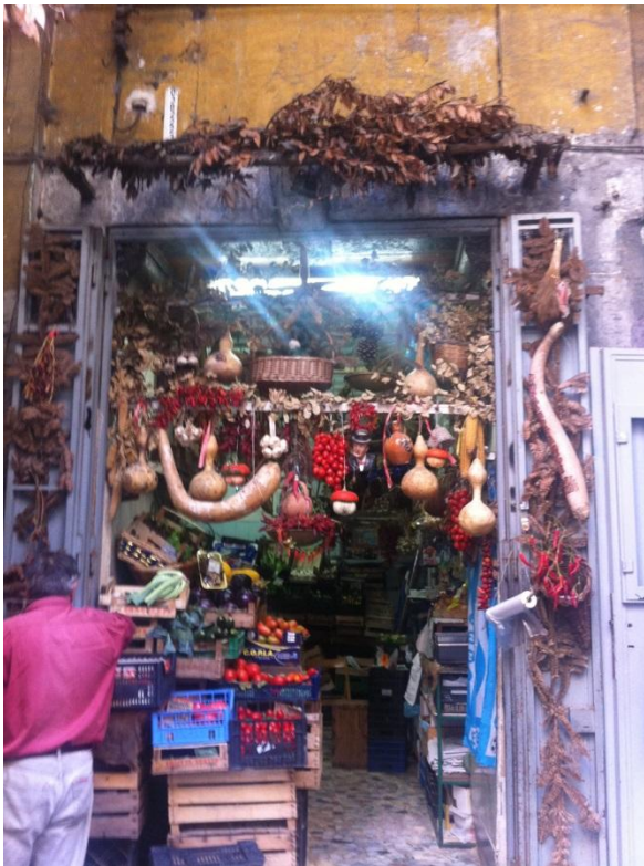
Detalj iz šetnje po Napulju