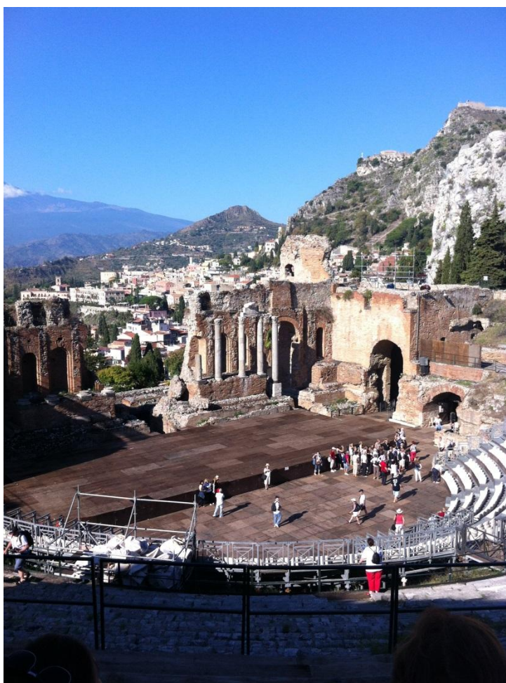
Teatar u Taormini

Odmah po buđenju, bez kajgane u želucu, zaputili smo se u Taorminu (lat. Tauromenium; grč. Ταυρομένιον) – stari gradić iznad Naxosa, s izvorno grčkim teatrom, koji su Rimljani ponovno u 2. stoljeću prije n.e. izgradili na istom mjestu. Slobodno vrijeme proveli smo šetajući se oko teatra i uživajući u pogledu na Jonsko more. Gradić je lijep, ali za moj ukus, prenatrpan suvenirnicama. Čini mi se da su suveniri jedino od čega to stanovništvo živi. Vidjela sam i suvenir-magnet sa slikom Mussolinija. Iako je ispod slike pisalo „Dux“, nisam bila sigurna je li to zaista on, jer mi je to bilo nevjerojatno, pa sam upitala prodavačicu tko je to, i sa smiješkom na licu mi je odgovorila: „Pa Mussolini!“. Nije mi baš jasno kako se to smije prodavati, iako i mi u našoj suvenirnici u Zagrebu imamo i ne baš primjerene artikle s asocijacijama na neslavno doba naše povijesti. U Njemačkoj, gdje je čak i zabranjena prodaja i tiskanje Hitlerove knjige „Mein Kampf“ (osim u povijesno-istraživačke svrhe, za što se mora predložiti posebna iskaznica i opravdanje), takvo što bi zasigurno završilo na sudu.