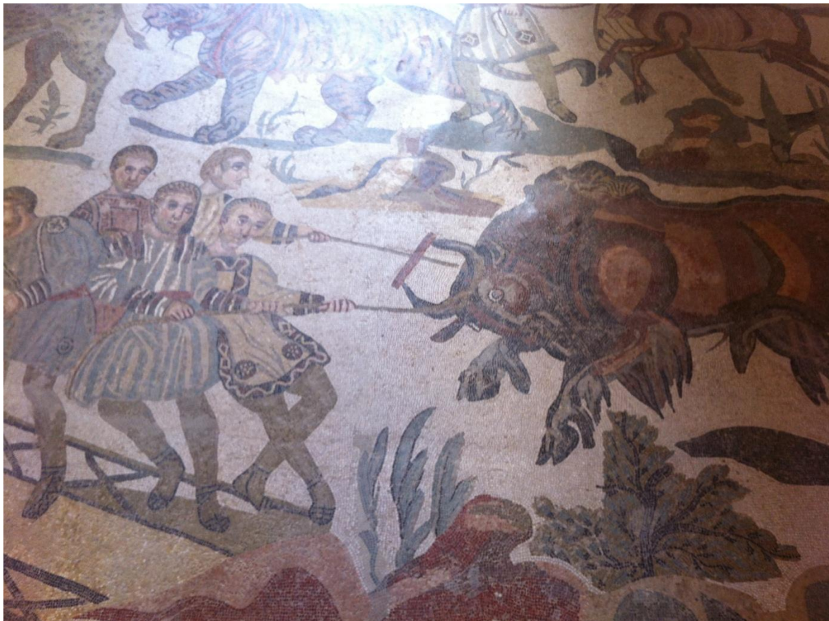
Mozaik iz Maksimijanove vile

U okolici Piazza Armerine nalazi se rimska vila, točnije Villa Romana del Casale, koju smo također posjetili. Vila je izvorno najvjerojatnije pripadala Maksimijanu, suvladaru cara Dioklecijana. Izgrađena je u 4. st., a napuštena u potpunosti u 12. st. Posebnost joj, osim veličine, daju podni mozaici – naime, svaka prostorija vile njima je ukrašena, i svaki mozaik priča svoju priču, te nam tako odaje način života ondašnjeg doba.