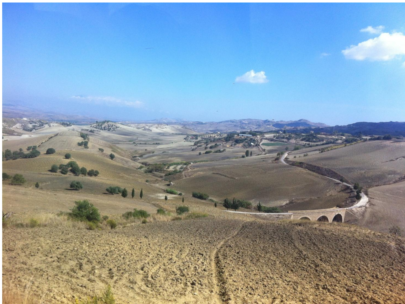
Panorama unutrašnjosti Sicilije

Popili smo kavu i krenuli u vožnju prema Enni, odnosno Piazza Armerini, vidjevši usput iz autobusa prekrasnu panoramu grada Caltagirone s neizmjernim poljima okolo, kakve ćemo često viđati u unutrašnjosti Sicilije.