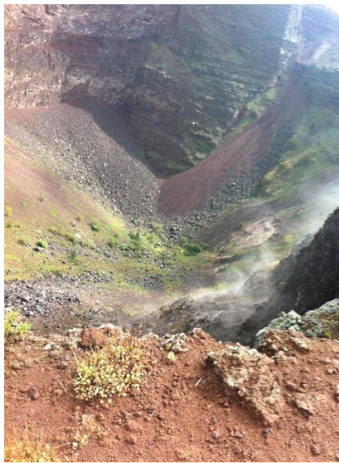
Krater na Vezuvu

Kada smo se spustili, išli smo ravno do Kume (lat. Cumae; grč. Κύμη), najstarije i najsjevernije grčke kolonije na italjskom tlu, gdje sam već prije nekoliko godina bila sa srednjom školom. Nervozno i nezgrapno pročitala sam svoj referat o Kumi i Flegrejskim poljima, što zbog prirodnog straha od javnog nastupa, što zbog iscrpljenosti i umora, a i nije mi išlo ni u korist to što sam imala veliku gužvu u obavezama cijeli osmi i deveti mjesec, tako