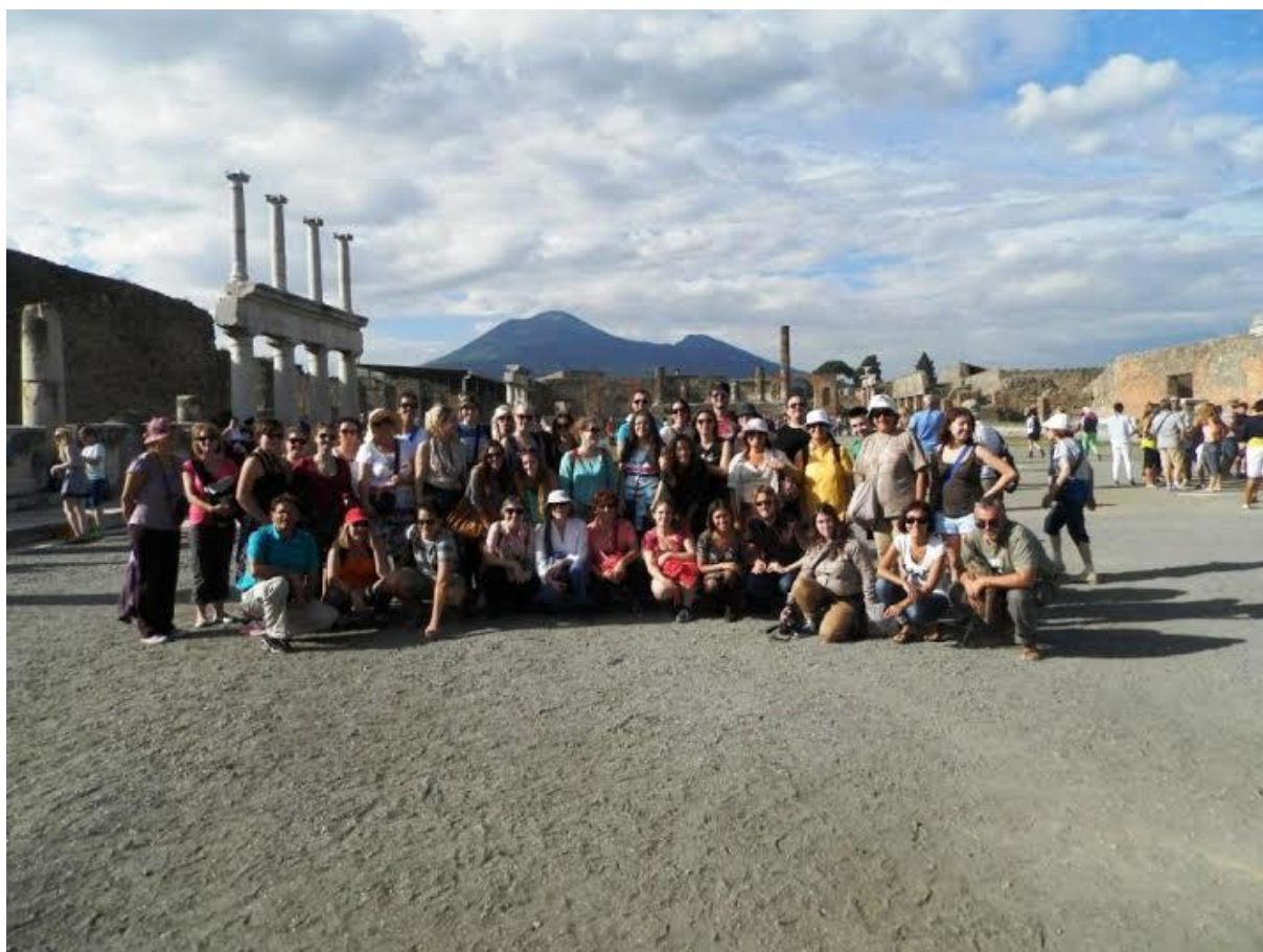
„Michelangelo!“, zajednička fotografija u Pompejima, Vezuv u pozadini

U Pompejima se nalazi Apolonov hram, Jupiterov hram, Vila misterija s izvrsno očuvanim freskama, amfiteatar i mnoštvo drugih zanimljivosti – zalogajnice, kuće, bordeli... Ukratko, život u tom gradu nije bio nimalo dosadan. Kroz lokalitet nas je vodila simpatična, neprestano nasmiješana turistička vodičkinja. Na glavnom smo trgu konačno napravili zajedničku fotografiju, uz Sanjinov uzvik „Michelangelo!“, gdje sam umrla od smijeha.