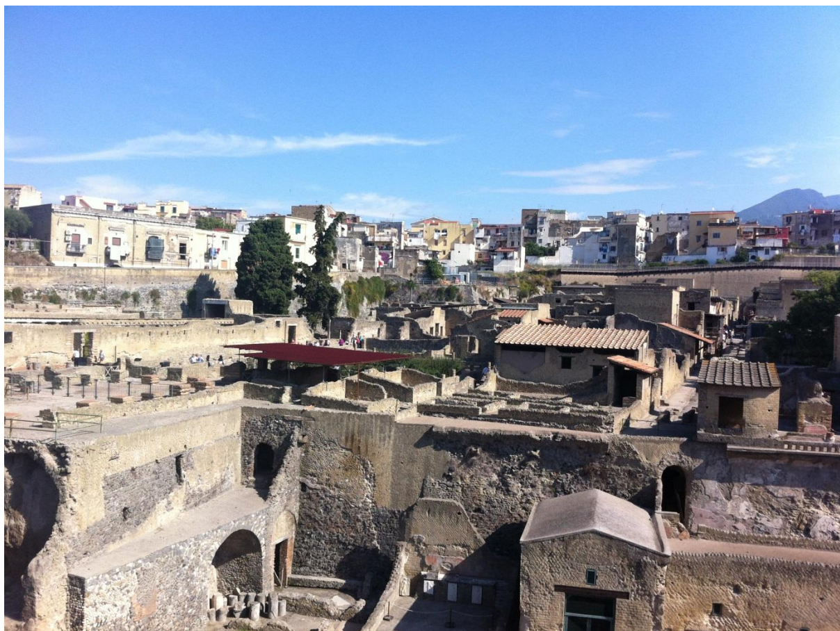
Suživot starog i novog - Herkulanej

Iako nije bilo kajgane za doručak, dan je počeo izvorsno. Prvo smo posjetili Herkulanej (lat. Herculaneum), antički grad u Napuljskome zaljevu, koji je stradao 79. godine od erupcije Vezuva, kao i Pompeji, te je i iz tog razloga dobro očuvan – naime, ti su gradovi više od tisućljeća i pol ležali ispod naslaga blata, pepela i kamenja, koje ih je ostavilo gotovo