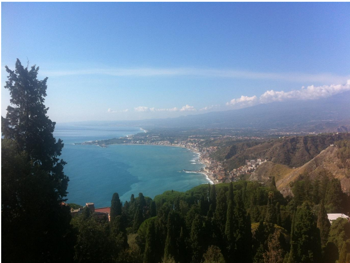
Pogled na Jonsko more

U jednom trenutku dogodilo se nešto neočekivano i ne baš ugodno – jedan od turista doživio je težak napadaj epilepsije i nisam znala što bih učinila. Njegovi su se pobrinuli za njega, položili su ga u pravilan položaj, na bok, kako slučajno ne bi došlo do toga da proguta jezik ili da povraća. Treba uvijek biti spreman na svakakve situacije i znati osnove prve pomoći. Kasnije je došla hitna pomoć, nadam se da je sve bilo u redu.