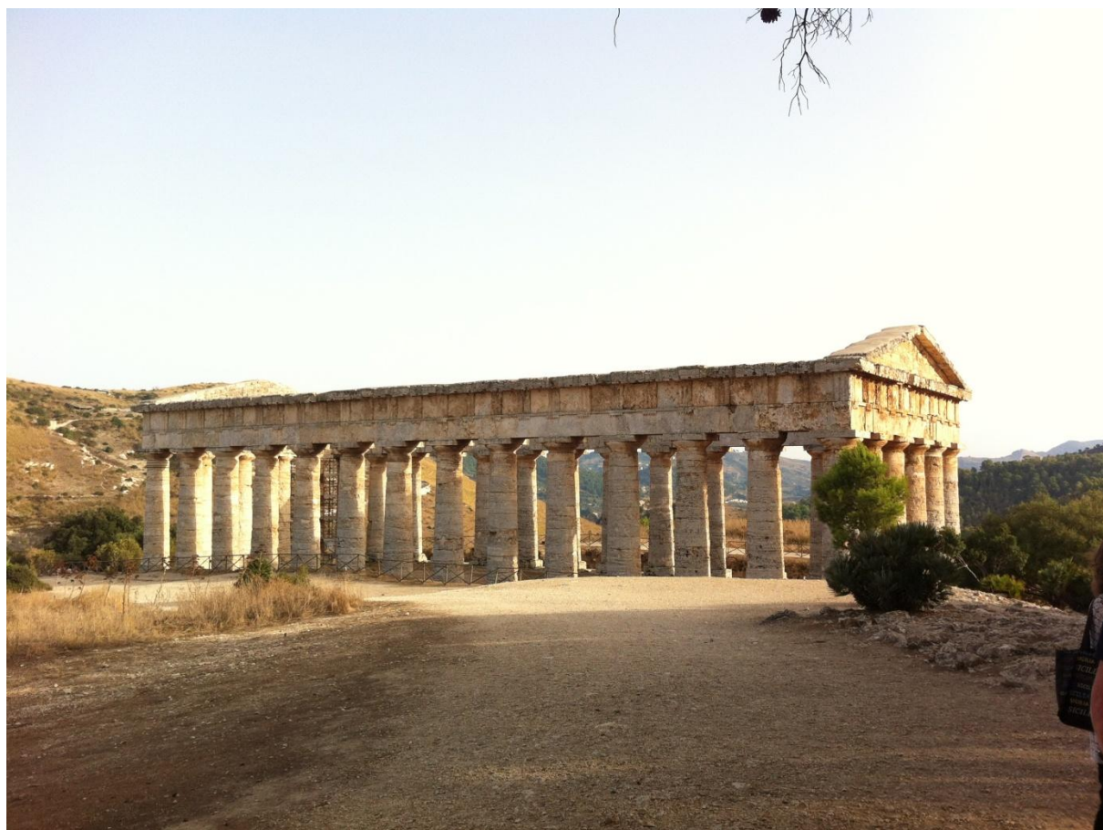
Hram u Segesti

U Segesti, arheološkom centru na planini Barbaro, vidjeli smo grčki teatar iz 4. ili 5. st. prije n. e., kasnije renoviran od Rimljana, i, iako napušten prije završetka izgradnje, zbog okupacija teritorija od strane Kartažana, veoma dobro očuvan dorski hram, posvećen najvjerojatnije božici Dijani.