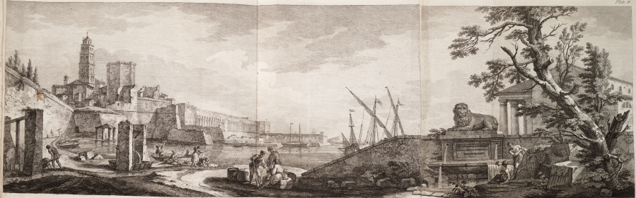
View of the Ruins of Spalatro from the South West